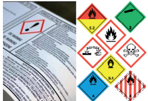
Sector Químico ( GHS )