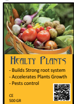
Horticultura, Plantas y Semillas