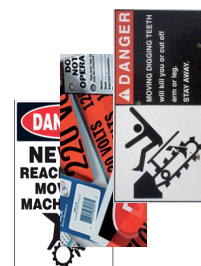
Maquinaria e Instalaciones

Las nuevas tintas y cabezales de avanzada tecnología, permiten a la nueva VP495 conseguir gráficos de alta calidad , códigos de barras y textos bien definidos gracias a su alta resolución de 1200x1200 dpi – resolución desconocida para cualquier otra impresora en el mercado hasta la fecha, basada en tintas de pigmento.